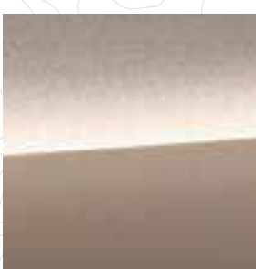
Brilliant Bronze Metallic