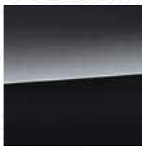
Crystal Black Silica