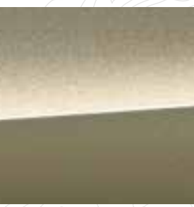
Autumn Green Metallic