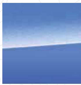
Daybreak Blue Pearl