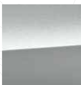
Ice Silver Metallic