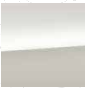
Crystal White Pearl