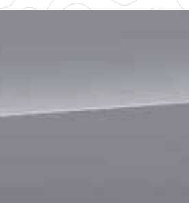
River Rock Pearl