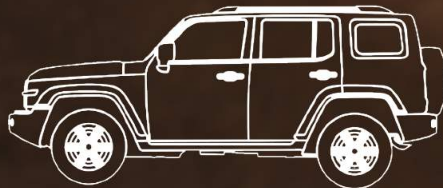
DIAGRAMA DE DIMENSIONES